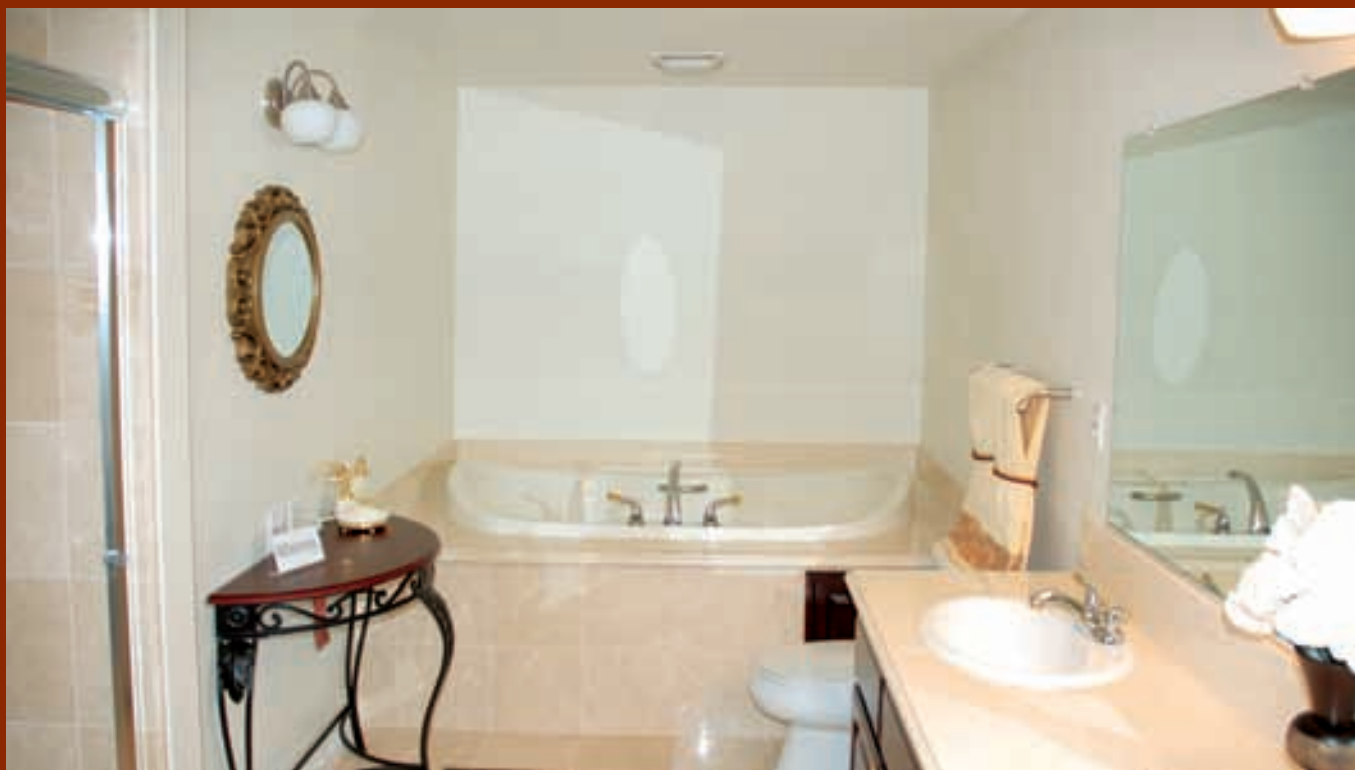
Primjer hotelske kupaonice - jednostavno i bez zidova obloženih pločicama