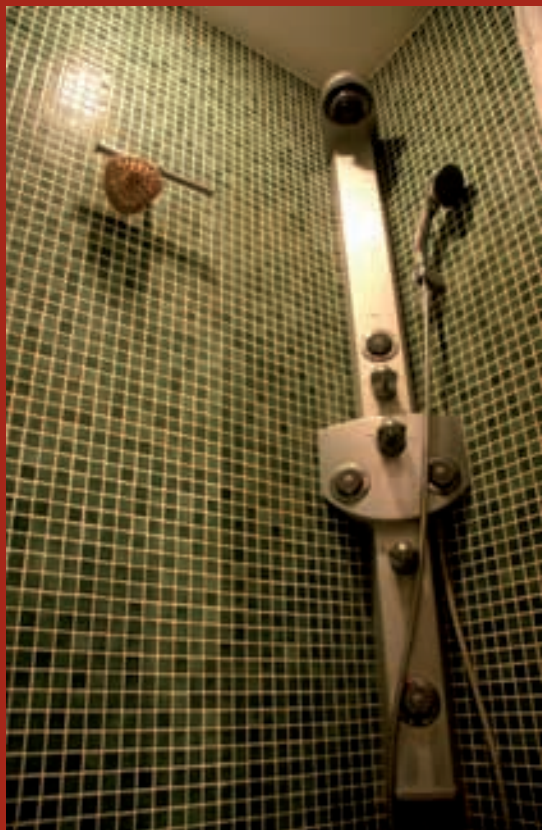
Moderna i lijepa tuškabina

Usvojena je komunikativna inverzija tako da se kroz kupao- nicu prolazi do spavaće sobe kako bi se dobila povezanost nje i WC-a radi lakše izvedbe novih dovodnih i odvodnih instalacija. Time i soba dobiva svoje kvalitete: izravan pri- stup balkonu i veće otvore, što znači više zapadnog sunca i svjetla. Raspored željenih elemenata u obje prostorije uvje- tovali su točnu poziciju i način otvaranja dvoja vrata koja spajanjem formiraju kosi prolaz, razdvajajući kupao- nicu na dva dijela.