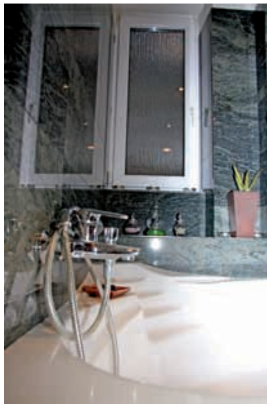
Pogled na kadu i mali prozor

Svaka adaptacija postojećeg prostora, pogotovo stare zgrade, podrazumijeva prihvaćanje kompromisa. Sobe orijentirane na uličnu, bučnu stranu postale su dnevni boravak, a gospodarski dio stana orijentiran prema dvorištu doživio je značajnu promjenu. Uklonjeni su tanki pregradni zidovi između postojeće blagovaonice, kuhinje i izbe tako da je dobiven lijep, velik prostor površine oko 20 m 2 koji će poslužiti za organizaciju spavaće sobe i nove kupaonice (s naglaskom na kupaonicu).