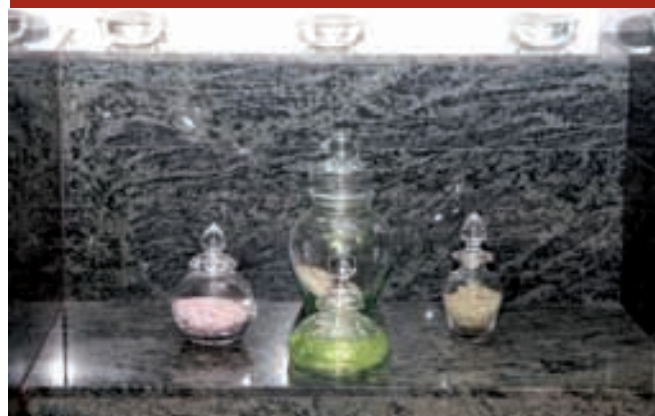
Neizostavni sitni detalji