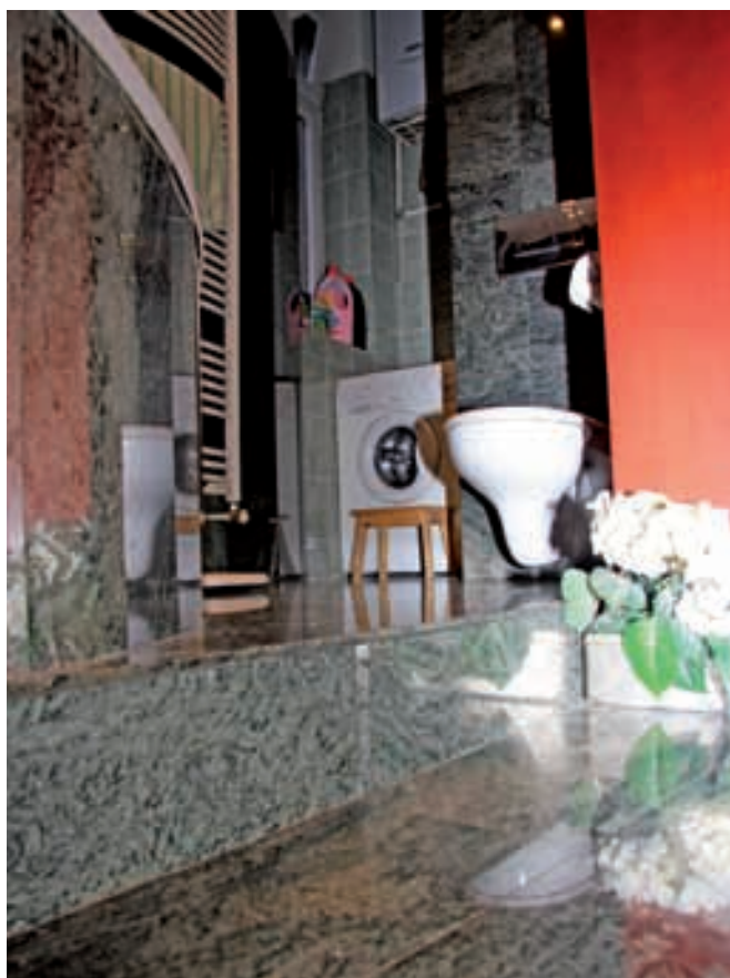
Veći dio kupaonice podignut je na podest