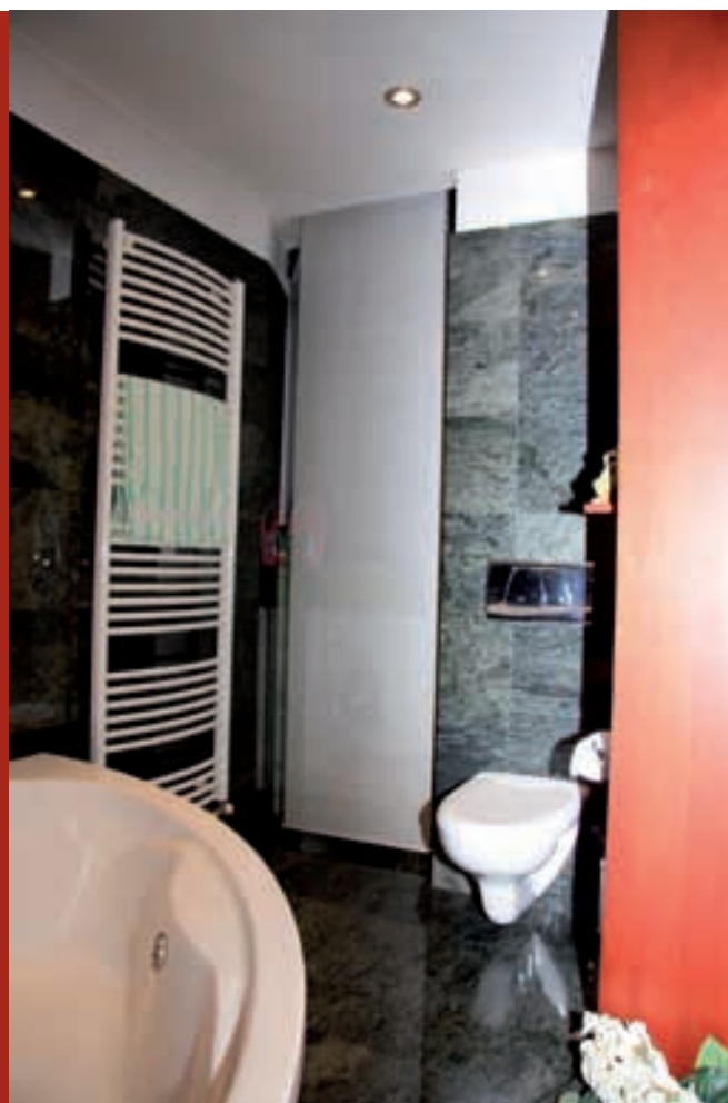
Pogled na WC i odvojeni prostor za perilicu rublja i plinski bojler