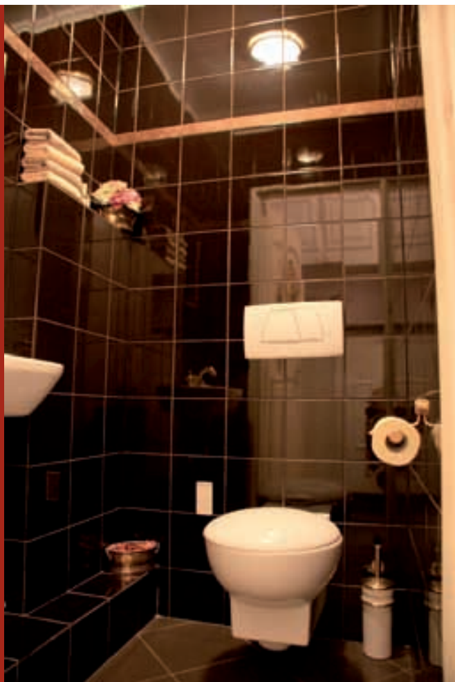
Odvojeni prostor WC-a