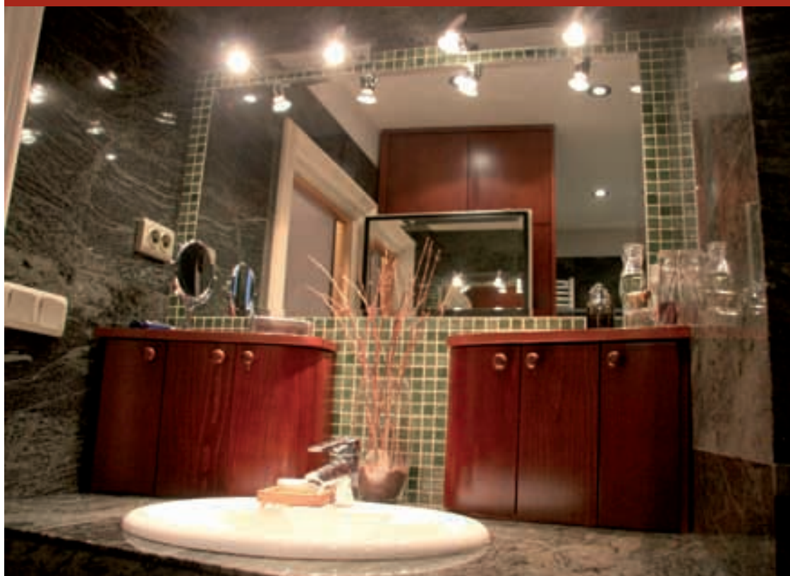
Pogled na umivaonik