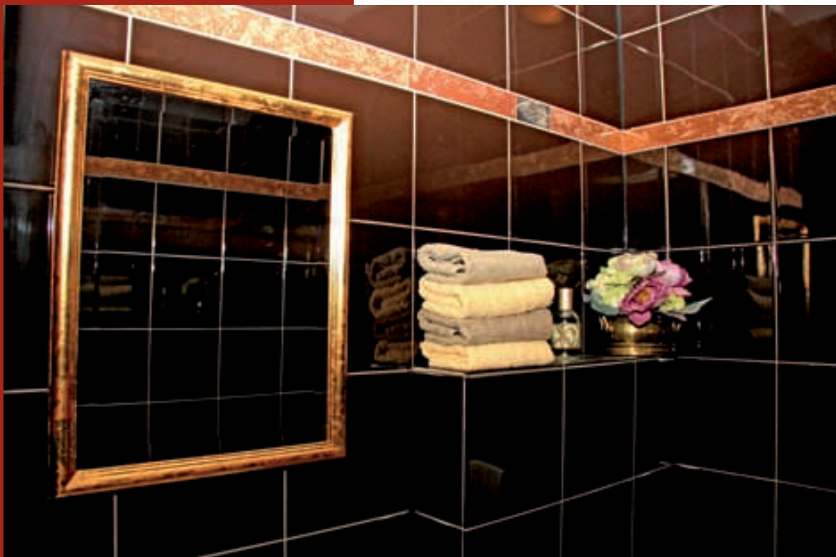
Kod uređenja se pazilo na svaki detalj

(Tatjana BURIĆ, dipl. ing. arh., 3D prikazi: Goran ERENT, aps. arh.)